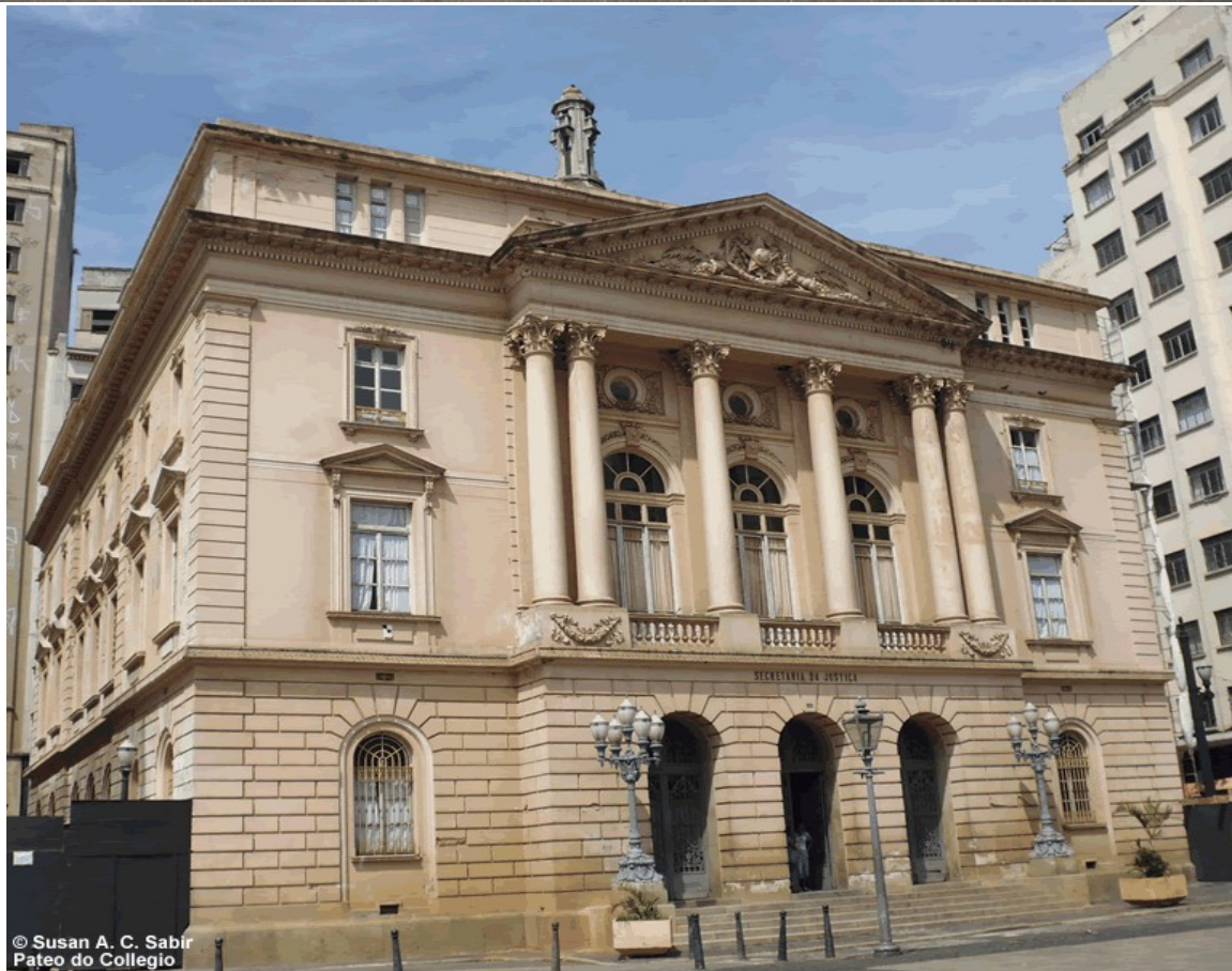
© Susan A. C. Sabir Pátio do Colégio