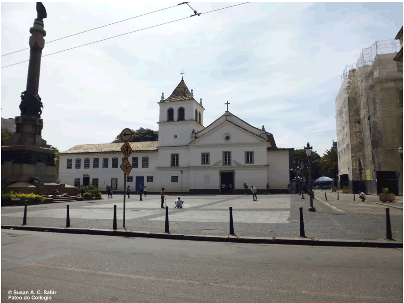
Pátio do Colégio