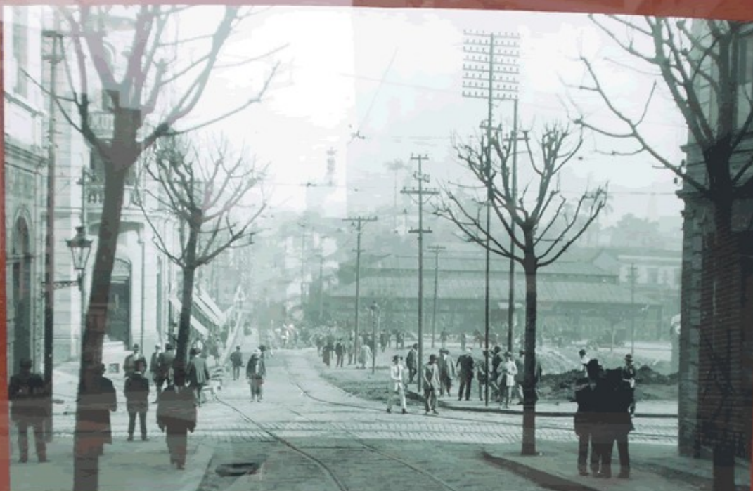
Desconhecido: Rua São João, 1906 a 1914 - Acervo Iconográfico do Museu da Cidade de São Paulo

C antada na letra de célebres canções, a Avenida São João é uma das vias mais emblemáticas de São Paulo. Sua origem remete ao caminho que ligava a antiga Ladeira do Açú (atual Praça Antônio Prado) à Região Oeste. O trecho inicial recebeu o nome de Ladeira de São João em 1865. No começo do século 20, passou por diversas reformas e prolongamentos, tornando-se conhecida como "Cinelândia Paulista" por seus cinemas, cafés, teatros e lojas. Após a construção do novo Vale do Anhangabaú, finalizada em 1991, este trecho recebeu o nome de Boulevard São João: voltado exclusivamente para o trânsito de pedestres e com espaços para atividades culturais e de lazer, esta região conta com atrativos como a Praça das Artes e o Prédio Histórico dos Correios.